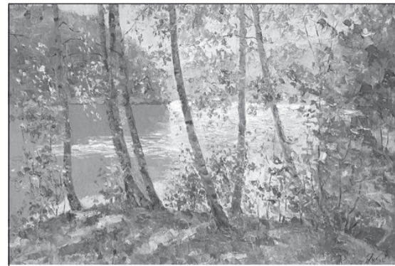
Работа А. Ячкова.

Произведения автора находятся в Ивановском областном художественном музее, в частных коллекциях собирателей живописных произведений из России, Канады, Франции, Англии, Германии и Польши.