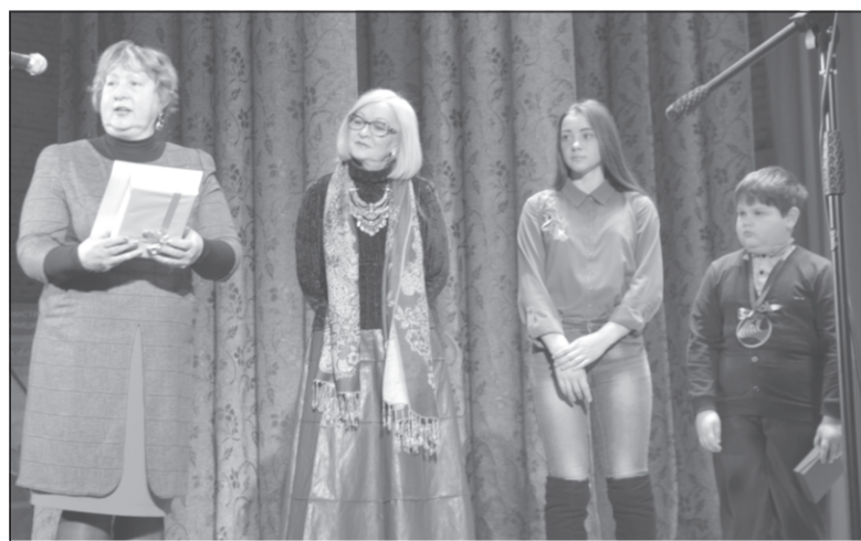
Открытие церемонии награждения.

Экспозиция будет работать с 6 апреля до 28 мая. График: с 10.00 до 18.00, выходной - понедельник. Музей пейзажа: г. Плес, ул. Луначарского, 20.